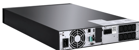
1000VA - 1500VA

*Czas podtrzymywania liczony przy PF=0,8 oraz 75% obciążenia. Skontaktuj się z naszym Działem Handlowym, aby poznać szacowany czas podtrzymania przy zastosowaniu innych parametrów. **Dla standardowej ładowarki. ***Waga bez baterii.